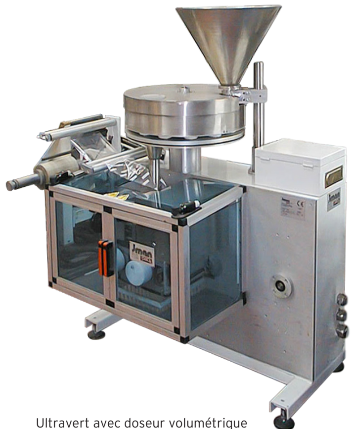
Ultravert avec doseur volumétrique

Pouvant être synchronisée avec des doseurs volumétriques, des peseurs multi-têtes, des dispositifs de sélection.